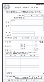
別送品申告書 (黄色い用紙)