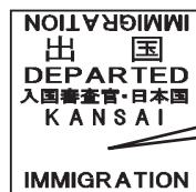
日本を出国した時のスタンプ